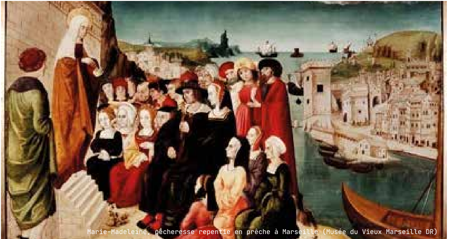
Marie-Madeleine, pêcheresse repentie en prêche à Marseille